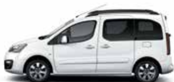
БЕЛЫЙ ЛАК (O)