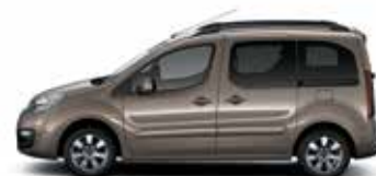
КОРИЧНЕВЫЙ ОРЕХ (M)