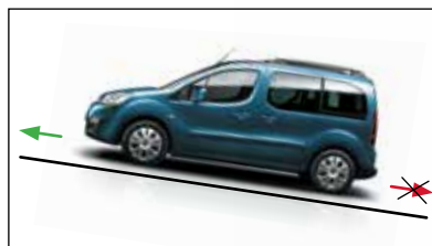
СИСТЕМА ПОМОЩИ ПРИ ПОДЪЕМЕ

Противотуманные фары с функцией статического освещения поворотов создают дополнительный световой луч, который освещает внутреннюю часть поворота или перекрестка, что улучшает видимость и позволяет вовремя обнаружить препятствия.