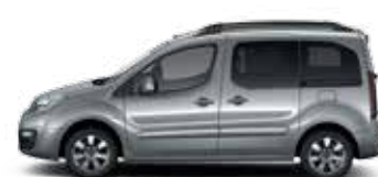
СЕРЫЙ МЕТАЛЛИК (M)

Цвета доступны в зависимости от комплектации