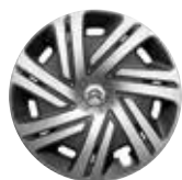
15-дюймовый колпак AIRFLOW