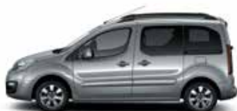
СЕРЫЙ СТАЛЬНОЙ (M)