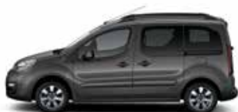
КОРИЧНЕВЫЙ МОККО (N)