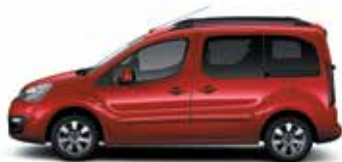
ЖГУЧИЙ КРАСНЫЙ (O)