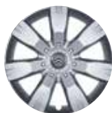
16-дюймовый колпак RANGIROA